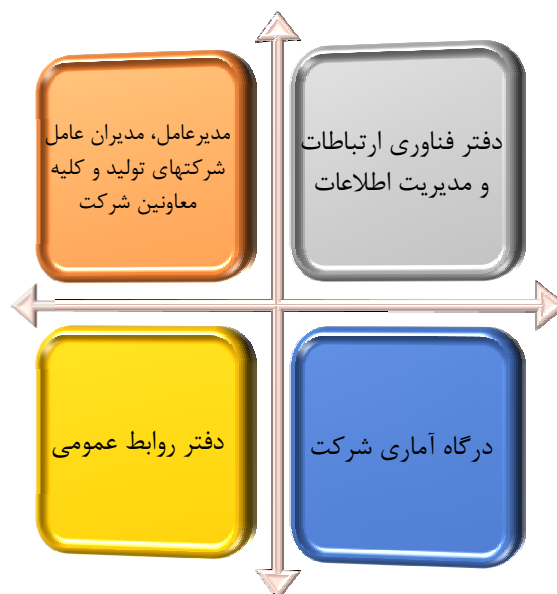
شکل 1: مجراهای آماری مورد تایید شرکت برق منطقه‌ای غرب جهت انتشار آمار و اطلاعات

1-2-4- حوزه‌های شرکت برق منطقه‌ای غرب فقط از طریق مجاری زیر می‌توانند نسبت به انتشار " آمارهای رسمی " اقدام نمایند و هرگونه اشاعه اطلاعات آماری توسط سایر مسئولین غیرمرتبط، فاقد ارزش اعتباری و استنادی است.